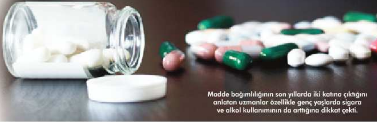
➔ Madde bağımlılığının son yıllarda iki katına çıktığını anlatan uzmanlar özellikle genç yaşlarda sigara ve alkol kullanımının da arttığına dikkat çekti.

olduğu ve yüzde 2,7'sinin ise öğrenci olduğu görülmektedir. Eğitim ve öğretim düzeyi düştükçe madde kullanım/bağımlılık sorunu artmaktadır. Tedavi gören hastaların; yüzde 70,7'si 'ilk ve ortaöğretim mezunu, yüzde 24,4'ü lise mezunu, yüzde 3,3'ü yükseköğretim mezunu, yüzde 1,7'si hiç okula gitmemiş olduğu görülmektedir" ifadelerini kullandı. | SAYFA 3