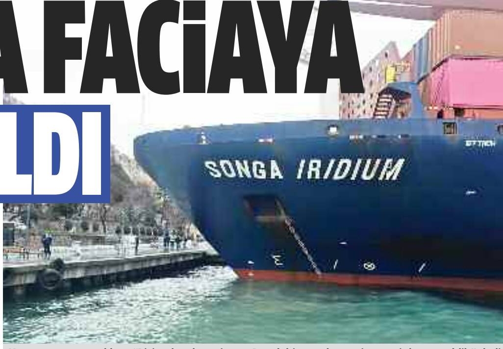
Kazanın görgü tanıkları, "Bizim de teknemiz var. Büyük bir gürültü ve siren sesi duyup geldik" dedi.

Sarıyer Aşıyan'da "Songa İridium" adlı kuruyük gemisi kıyıya çarptı. Valilikten yapılan açıklamada, "Kaza nedeniyle gemi mürettebatı veya kaza mahallinde herhangi bir yaralanma veya can kaybı yoktur. Römorkörler ile kurtarma çalışmalarına başlanmış olup, şuan itibarıyla herhangi bir deniz ve çevre kirliliği söz konusu değildir" denildi