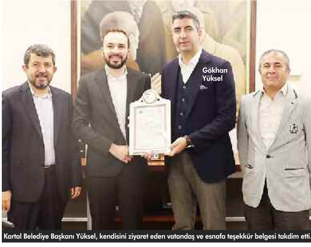
Kartal Belediye Başkanı Yüksel, kendisini ziyaret eden vatandaş ve esnafa teşekkür belgesi takdim etti.

İstişare makamının önemine vurgu yapan Başkan Gökhan Yüksel, "Fikir alışverişine büyük önem veriyor ve yalnızca vatandaşlarımızın ihtiyaçlarına cevap verecek projelerle ilgileniyoruz. Göreve geldiğimizden beri bu anlamda Kartallı komşularımızla belediyemizin iletişimini güçlendirmek için birçok mekanizmayı harekete geçirdik. Mahalle buluşmaları ve halk günü bunun bir parçasıdır, yeni kurduğumuz 'Komşu İletişim Merkezi' de diğer bir parçasıdır. Sivil toplum örgütlerimizin ve meslek odalarının fikirlerini alabilmek için sık sık bir araya geldik ve gelmeye devam ediyoruz. 10 yıllık gelenegimiz olan Muhtarlar Toplantımızı da bu anlayışla devam ettiriyoruz" dedi.