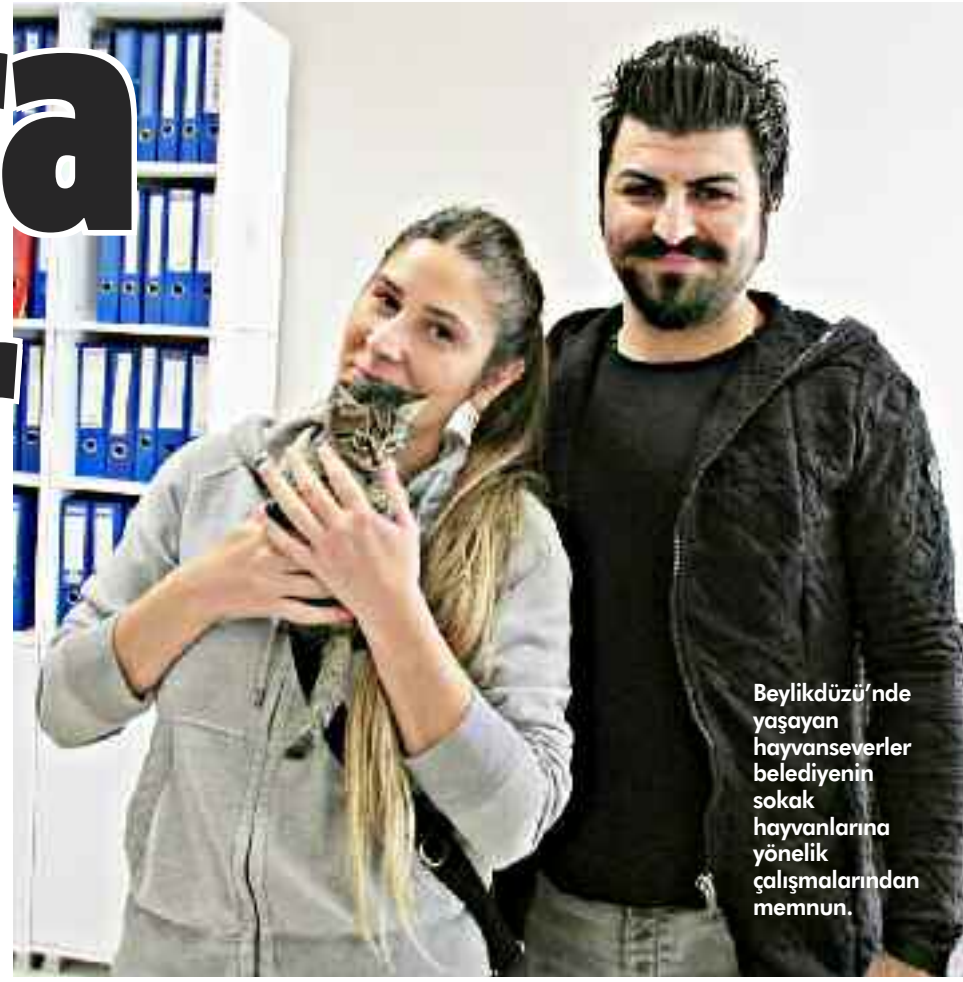
Beylikdüzü'nde yaşayan hayvanseverler belediyenin sokak hayvanlarına yönelik çalışmalarından memnun.

van sevgisini çocuklara aşılamak ve bilinçlen- dirme amacı ile ilköğretim ve dördüncü sınıflara yönelik olarak verilen "Kent Hayatında Sokak Hayvanları ve Hayvan Sevgisi" eğitimlerinde toplamda bin 110 öğrenciye ulaşıldı.